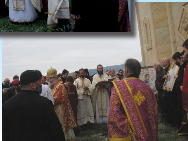
ბიულეტენი გამოდის ცხუმ-აფხაზეთის მიტროპოლიტ დანიელის (დათუაშვილის) ლოცვა-კურთხევით 2007 წლის ივლისიდან