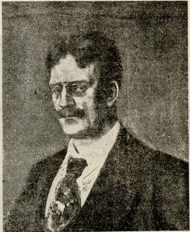
მწერალი და ღვაწლმწიფი კნუტ ჰამსუნი. (დაბადებიდან 50 წლის შესრულების გამო.)

ევგ. იყო და არა იყო, რა, არ ვიცი სად, ვსთქვათ შორეულ აღმოსავლეთში, არაბეთის ანუ ინდოეთის ერთ მდიდარ ქალაქში ერთი საწყალი ქვარევი. იმის მეუღლე, ფრიად პატიოსანი და მამაცი ოფიცერი, სიკვდილის შემდეგ, თავის ცოლსა და ერთად ერთ ქალს არაფერს სარჩოს არ უტოვებს, თავის იარაღის გარდა, მაგრამ ქალს დედისაგან გადაედება ერთი სულიერი თვისება—უყიდურესი თავმოყვარეობა. ქალი არც ძალიან ლამაზი იყო, არც მახინჯი, არც ძალიან ჰკვიანი და არც სულელი. დედას უყვარს ის უფრო, ვიდრე თავისი თვალის ჩინი, ეალერსება დედის უანგარო სიყვარულით. არაფერს არ ზოგავს იმისთვის, და თავის შეძლებაზე უფრო მეტ სწავლა-განათლებას აძლევს.