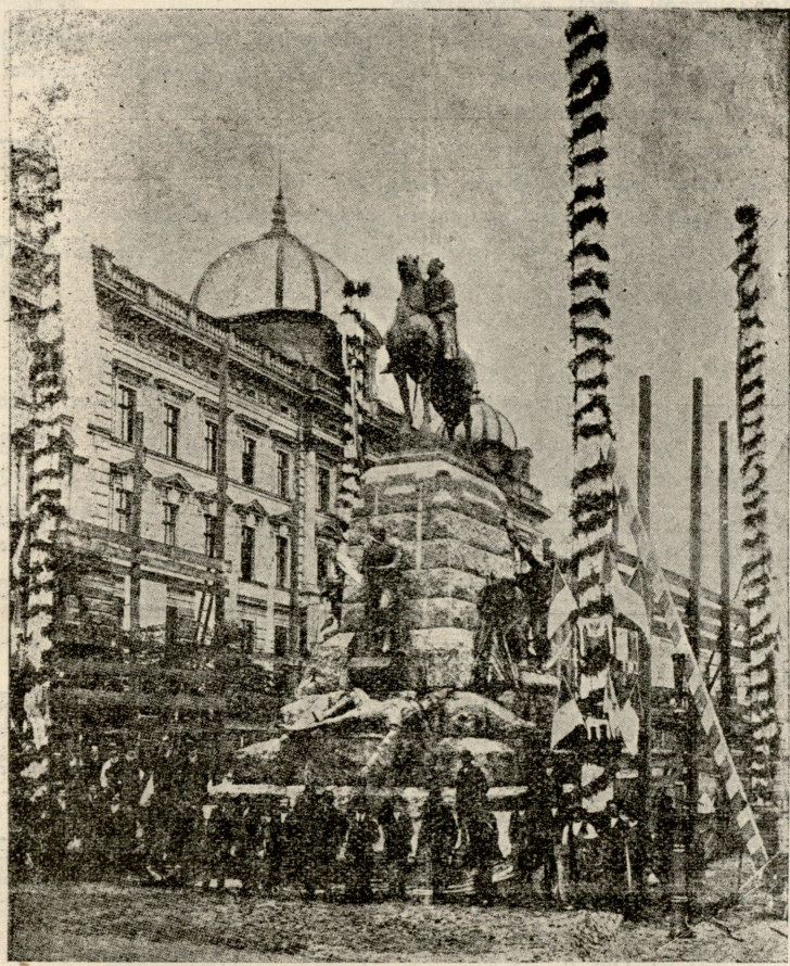
პოლონელთა საერო დღესასწაული. იაგელონს კმელი კრამოვში. (იხ. „სახ. გაზ.“ № 58)

მიპრ. (რომელიც ეურადღებოთ უსმენდა, ცოტა სიჩუმის შემდეგ) ეგ ზღაპარია? ეგვ. ზღაპარია... მიპრ. სულ მიაშბე? ეგვ. სულ.