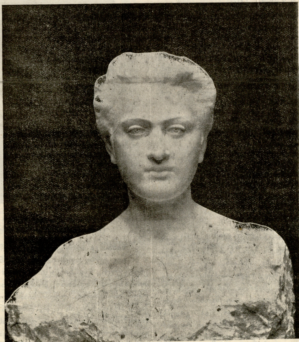
კორინთლის ქალის ბიუსტი-პარტრეტი. მარმარილო. ქანდაკება ი. ნიკოლაძისა.