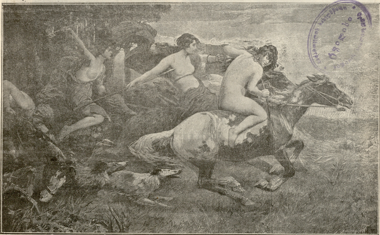
ამოკლმები. — სურათი ალტმიულერისა.

გაზეთის № 10 კ. კვირა, 12 სექტემბერი 1910 წ. დამატების № 18