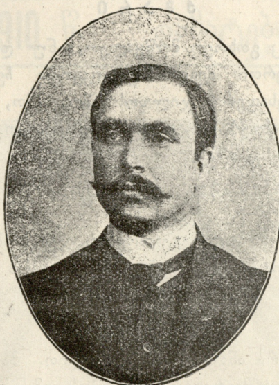
სიროლა ს.-დ, ბელადი.