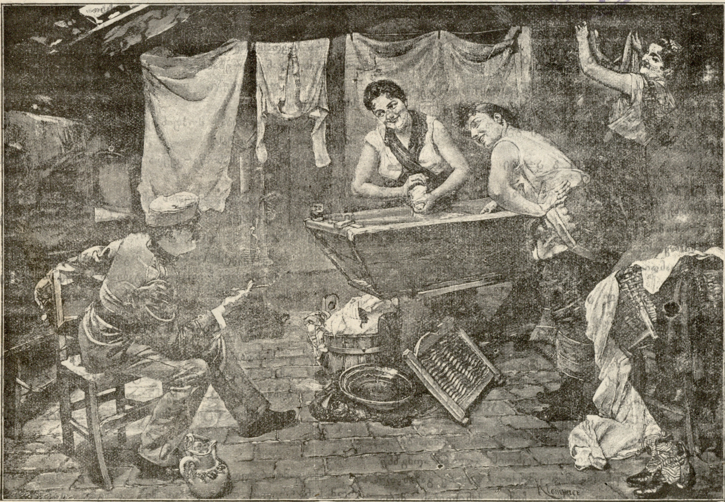
მხიარული სტუმარი, — სურათი კლამპანებისა.

გაზეთის № 128. კვირა, 10 ოქტომბერი 1910 წ. დამატების № 22