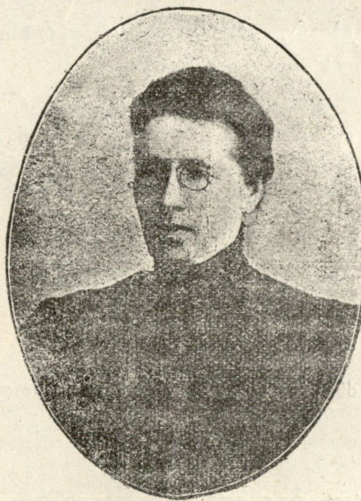
მინა სილანენოა—დევუბათი ძალი ს.-დ.

კარები გაიღება და ოთახში შემადიან შუახნის ცოლ-ქმარი, შავებში ჩაცმულნი; მწუხარება სა-