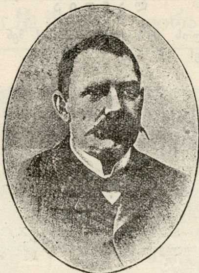
სვინსუვუდი, სიმიის თავიჯღომაჩა.