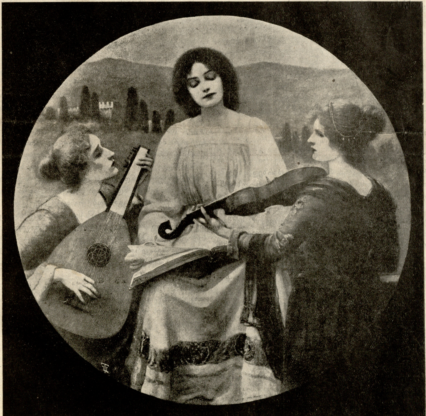
„აკორდი“, — სურათი ჰესლოინსა.