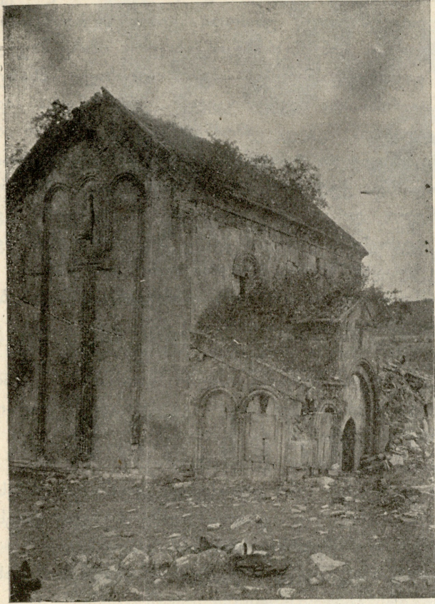
ბეთლემის დვითის-მშობლის (მაღალანთ) ეკლესიის ნანგრევები, აშენებულია (XII—XIII საუკუნეში) ს. წინარების მახლობლად.

ასეთს ფიქრშია ბეკო, წისქვილში მოულოდნელად შე- მოიქრება აღელვებული ჯვებე და მივარდება ბეკოს.