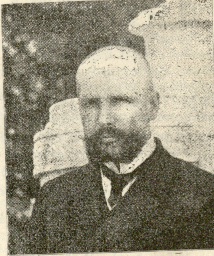
პრემიერ-მინისტრი პ. ა. სტოლიპინი.

— ალბად ასე ჰსურს ცათა მეუფეს!—ჯერ უნდა აწვალოს!