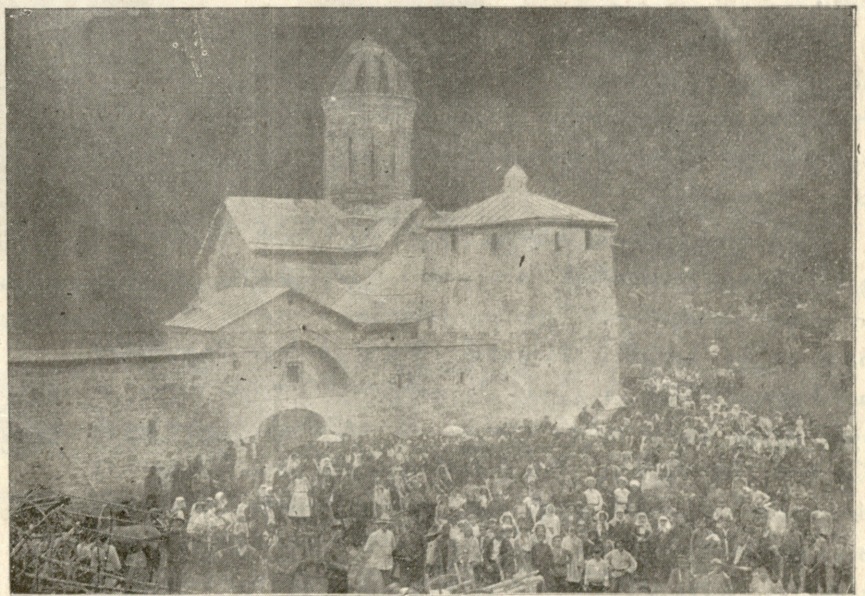
დღეობა ქვათახეში 15 მარტისთვის 1911 წ.

— ცეცხლი! ცეცხლი!—მას თავსბრუ ესხმის. სისხლი თავში მოაწვება, თავში აუვარდება. ცეცხლი ელვასაებ თვა- ლის წინ გაუელვებს. ჯვებე დატრიალდება, მოწყდება მიწას და დაეცემა.