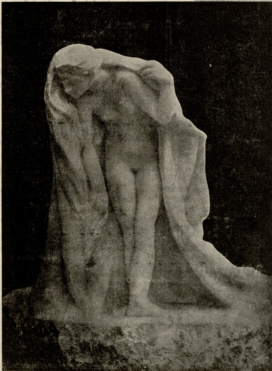
ა უ ზ ი ს ვ ი ნ ქანდაკება როდენისა.