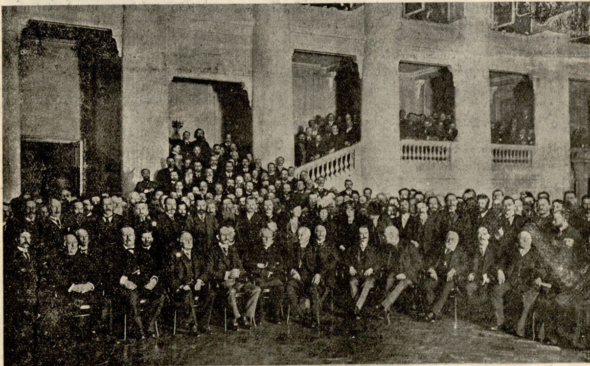
ინგლისელი სტუმრები რუსეთში.

— ეგ ხომ ძველი ბილეთია — დიდხანია ვადა გასული