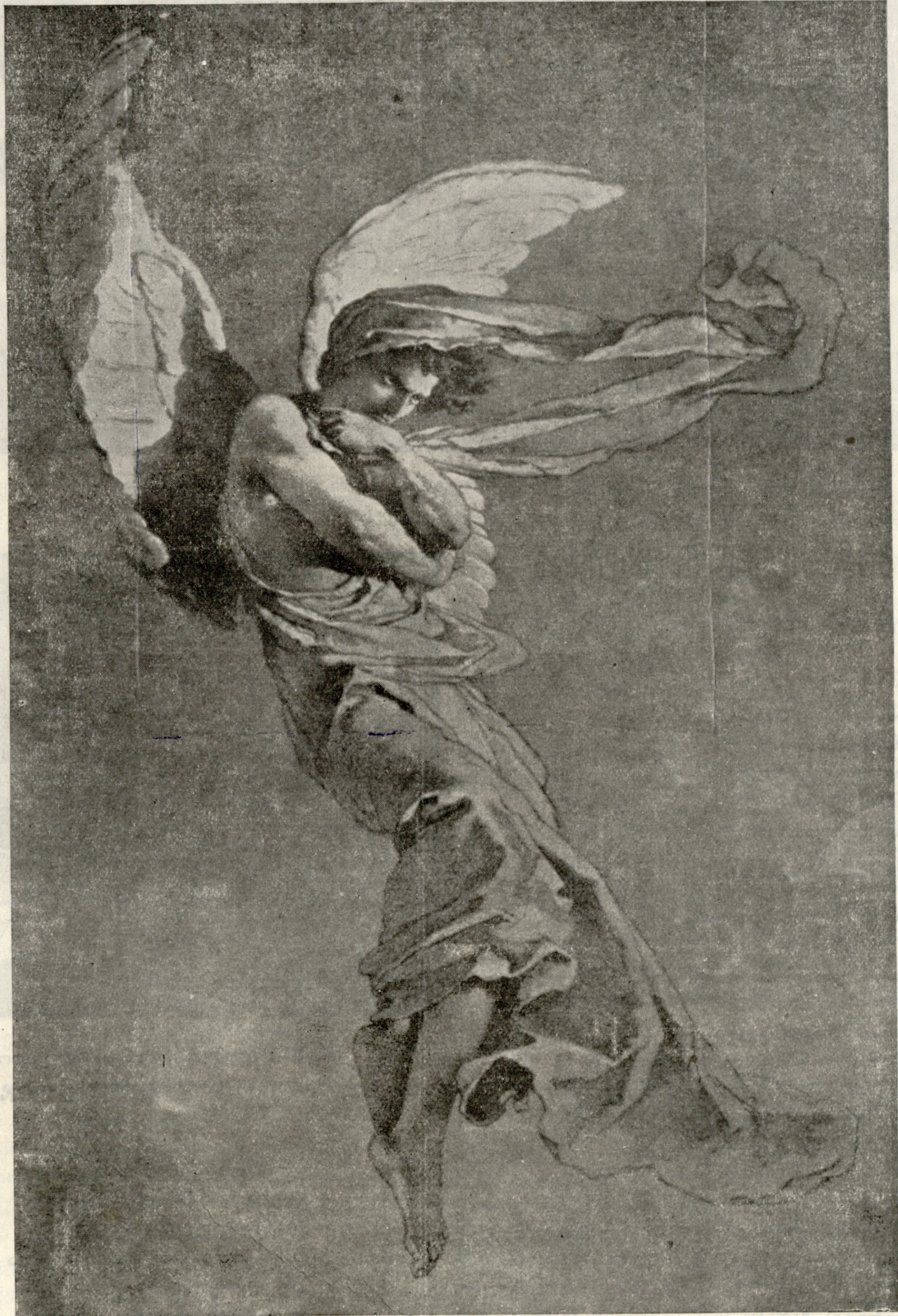
დემონი, ნახატი ზიჩისა.