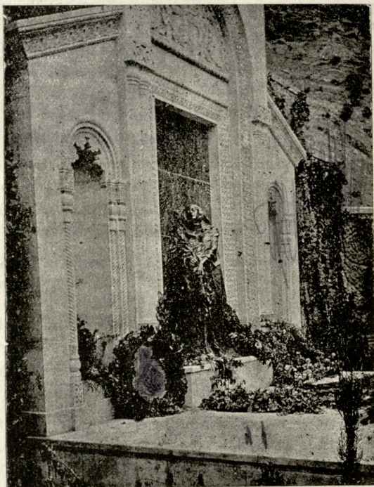
ილიას ძეგლი გვირგვინებითა და ყვავილებით.

„სამის არ დამსხმელი და არც შამსმელიო“. მართალია — უსამოდ გველი არა კვდება. ეუბნებოდა გამახარე ხევის ბერს და არც მოეშვა, ვიდრე სამი ყანწი არაყი არ დააღვინა ხევის ბერს და თავადაც არ დალია.