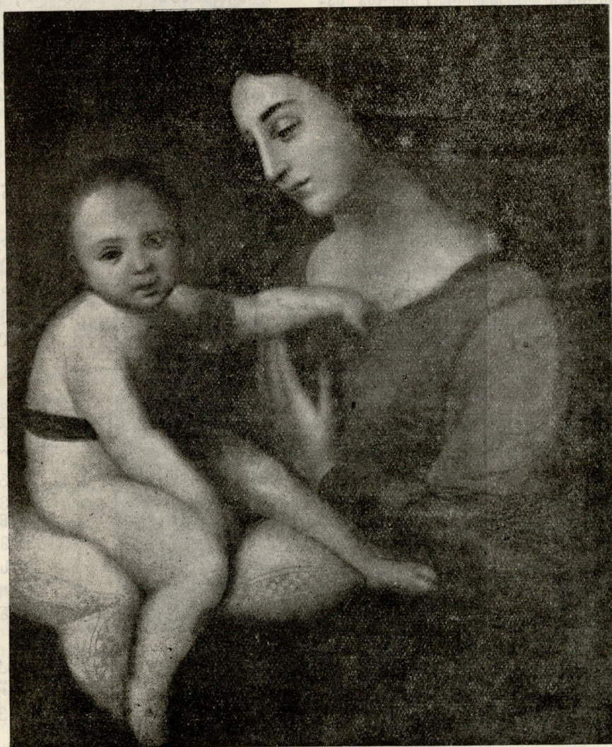
რაფაელის ახალი მადონა.