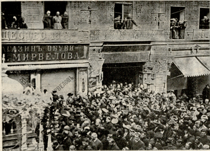
„სახალხო გაზეთი“-ს რედაქციის წინ.

მაია. აი, მას სურს, გასწიროს თავი და მით შეილი გა- დაარჩინოს.