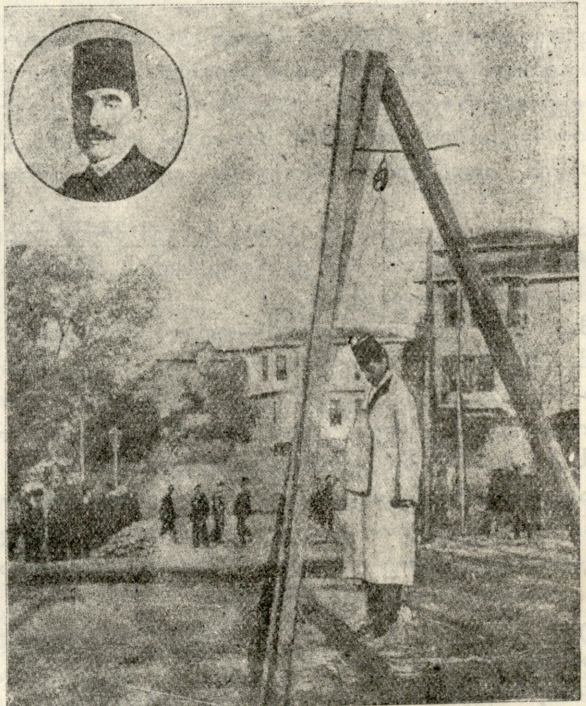
ოსმალეთის სულთანის სიძე — დამა-სალიჩ-ფაშა, რომელიც შეოქმულებთან ერთად ჩამოაზრჩვეს.

— ჩემდა გასაკვირად, ბ-ნმა გამგემ საჭიროდ არა სცნო იმა კაენის გვარი შეეტყობინებინა, ამის გამო მეტად უხერხულ მდგომარეობაში ჩავვარდი, — ამოიოხრა არქიელმა.