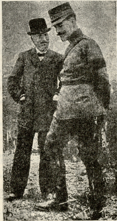
საბერძნეთის მეფე კონსტანტინე და პირველი მინისტრი ვენიზელოსი ბრძოლის ველზე.

— ყოვლისა უწინარეს უნდა გამოვარკვიოთ, ვინ არის ესე კაენი, და