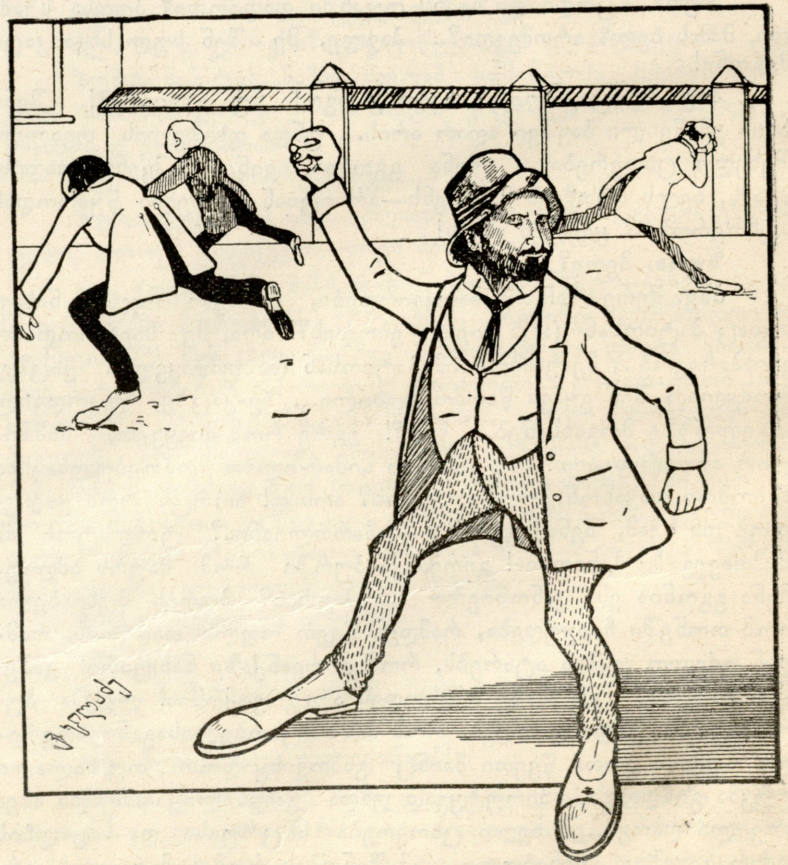
ჩვენი დროის მკლავაძე.