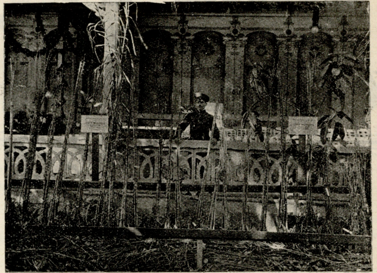
ბ-5 ჩივადის განყოფილება. გამოფენილია ნაყენ ვაზისა და სანერგეების ექსპონატები მისივე სანერგედან სოფ. აჯამეთში (ქუთაისის მაზრა).

ხელი ჰკრეს, უკან მოსდევს ნესტორ. ალ-რე მაგიდას უზის. ზურა ფარდას ამოფარება. შუა კარებში გლენები თავს შემოპყოფენ.)