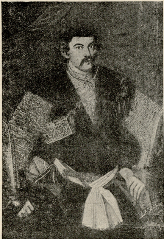
პირველი ფელდცენზებისტერი რუსეთის არტილერიისა ანჩილ მეფის ძე, ბატონი შვილი ალექსანდრე.

ესტ. ხმა. ვერც გამლახავ და თითხაც ვერ დამაწებ... (კაბინეტის კარები გაიღება და გამოვარდება ესტატე, სჩანს