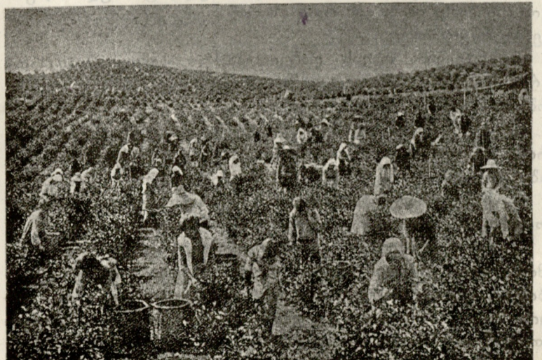
ჩაის მინდვრები ჩაქვში, ბათუმის ახლოს. სულ 50 დესეტინას შეიცავს. მოსავალი 250 ათას გირვანქა გამზარ ჩაის იძლევა. სურათზე ნახვენებია ჩაის ფოთლების კრეფა.

როგორც მუდამ, ეხლაც დაემორჩილა მას სიხარული. მან უკანასკნელი ღამე დაჰყო კაცთან, რომელიც თავის ანკა-