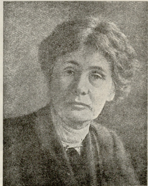
ინგლისელ სუფრაჟისტ ქალების ბელადი მისს პანკჰერსტი.

კალმახის ისტორია რომ გაიგეს, ატყდა ერთი სიცილ-ხარხარი. საჩქაროდ, რიგს გარეშე, ჩემი სადღეგრძელო დალიეს; ზოგი ჰერტრე მოციქულს მადარებდა, გენესარეთის ზღვაზე, რომ სასწაულებრივ თევზი დაიქირა, ზოგი მღვდლობას მისურვებდა, ზოგი კაი ცოლს, ზოგი რას და ზოგი რას.