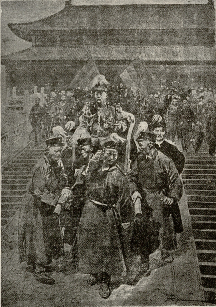
ჩინეთის პრეზიდენტი იუანშიკაი.

— ისტორიას კი არა მართალს ვამბობ, მამი ჩემის სული ნუ წამიწყდება, მშვიდად გააგრძელა უცნობმა.— ქუქია უზიაროდ გარდაიცვალა, პეხუ უზიაროდ გარდაიცვალა, ივა, როლამი, ამა რამდენი ჩამოვთვალა. არ მოვიდა, ყმაწვილო, სხვა მღვდელი არა, როცა გაგვიქირდა და გავიქეციო. თქვე ამო-