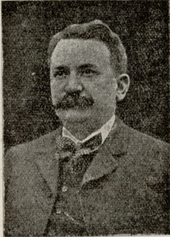
საფრანგეთის ახალი მინისტრ-პრეზიდენტი გასტონ დუმერგო.

— მე არ გეთანხმები ამაში, მაგრამ მართლაც რომ ყოჩაღად მოქცეულხარო, ექვი არაა, — სიცილით უთხრა მღვდელმა. — ახლა ეს მითხარი, ქადაგება და მაგისტრანებს ჩვეულია თუ არა ჩვენი მრევლი?