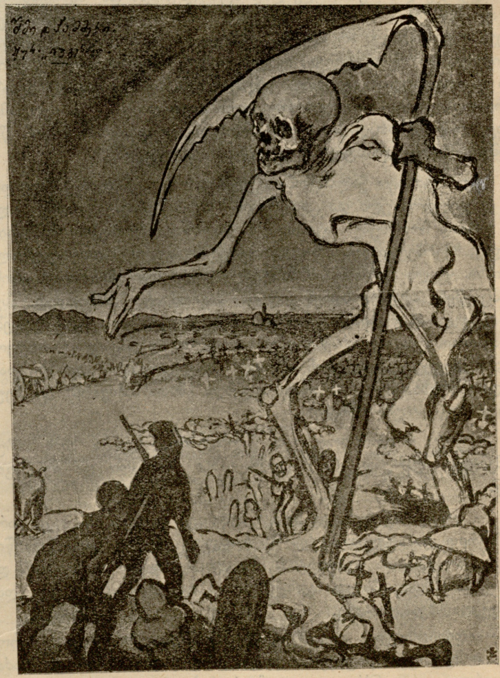
ბალკანეთის ბოროტი გმირი: „დაჰხოცეთ, დაჰხოცეთ! აქ ჯერ კიდევ ბლომადაა ადგილი...“ (ეურნ. „იუგენდითი“).