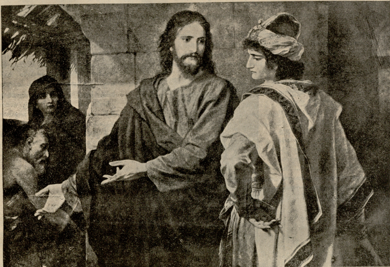
ქრისტე და მდიდარი ყრმა.