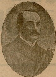
პროტოკოპოვი. შინაგან საქმეთა მინისტრი.