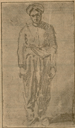
მესაფლავი ქურთი. ნახ. მუსაყვიას.