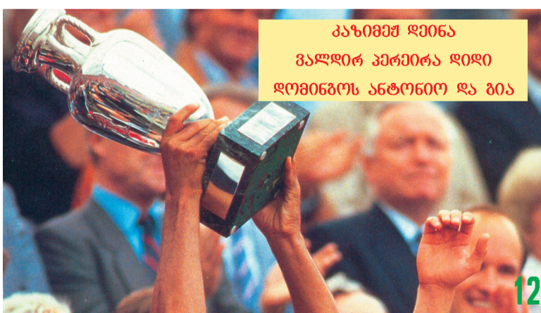
კახიფშ დინა ვალდირ პერეირა დიდი დომინგოს ანტონიო და ბია

რა ენაზე მეცხველებდენ იბარაბი? კუკური ფიფია