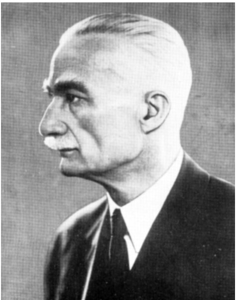
(გაგრძელება შემდეგ ნომერში)