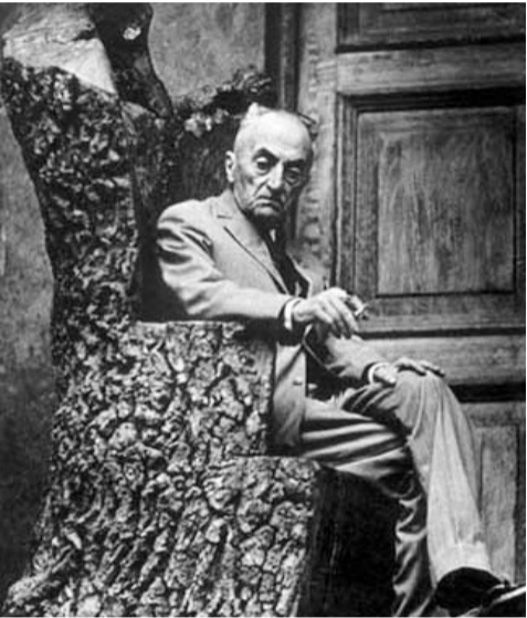
იგი 1893 წლის 15 მაისს დაიბადა სოფელ ძველ აბაშაში.