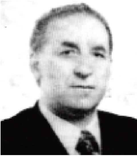
დასაწყისი "ილორი" №171-259

ნიკიტა ხრუშჩოვს ქართველთა შორის... პრეზიდენტი დეკაბრისტი პესტელი ამბობდა: „ქართველები ცივილიზაციაში უნდა გაეგნა...“