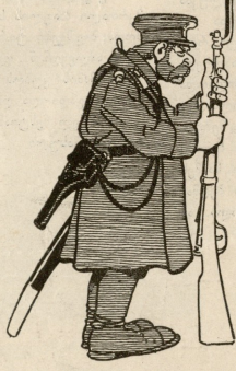
ასადა შევიადგებულე მამაგი დარაჯი.