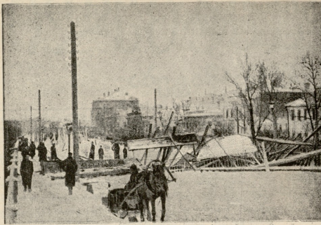
ბრძოლა მოსკოვში. — საღვთის ქუჩა აგვირბოვთან.