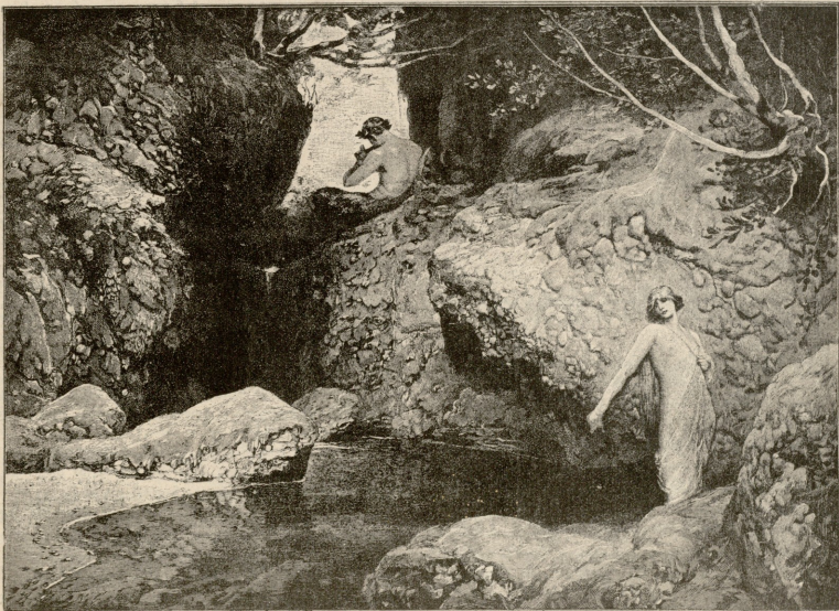
ნიფა. — სურ. კელდერისა.

ბივარ, საქმე ვერაფერი მიშოვია, აგერა შობაც თენდება და, ვინ იცის, გაბზოვება არ დაგვიბორნი! რა უნდა ვქნა ესეთმა ავიარამ მაშინ?