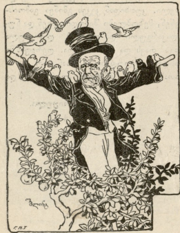
სადა დაჰკარგული საფოსტო.