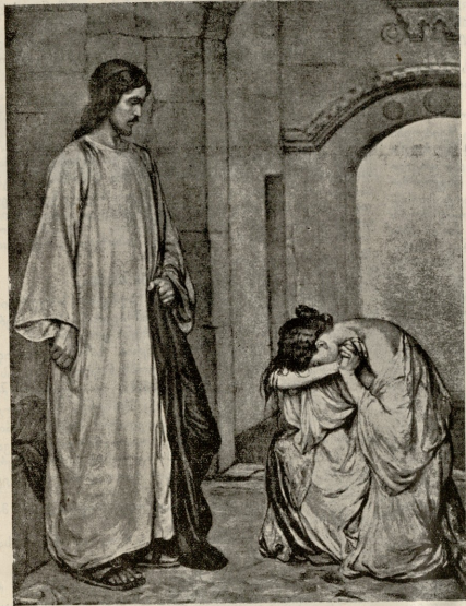
იესო ქრისტე და მძვავი ქალი.

ფიქრებს მიეცა, რა გვიარს, არ ვიცო; ხოლო აღსდგა რა ძალი მოსილი, ვითარცა ლოცვა, აღმოხდა ფიცი.