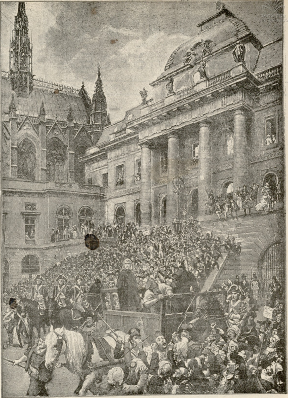
შარლოტა კორდე.—უშფოტე მიყვით.

საყვარელს ქმრის სიკვდილის შედეგ მარტო-მარტო დარჩა პატარა ბავშვით ხელში. იმას შესწირა მთელი თავისი სიკაცდღე, მშობელი თავისი სული და გული. შვილისთვის დედაც იყო და მსუქთთვის მგობარატი. მან მისცა შვილს სრული თავისუფლება განვიარების საქმეში. არ აწუხებდა, არ ავიწროებდა, წინ არ ეღობებოდა იმის მისწრაფებს. იგი არ შეზღუდა, არ მოსდებოდა ერთად-ერთი შვილი ნაშველ მებრ- ძოლთა რაზმზე დანიხსა და აზრადაც არ მოსვლია, დაეშალა ამ წინადა მშობელობის შესრულება. დღეა ეკაყოლილი და გახარებული იყო იმის წარმოდგენით, რომ პატროსანი მებრ- ძოლი გახარდა ხალხსთვის. შვილში სქნობდა თავის უღრო- ვლ-დაცარსთა ქმარს, რომელმაც მთელი სიკაცებუ კი- ხეებში დალია არდესაც გაისმა ხმა მოწოდებისა, როდესაც მოითხოვს სიკაცებზე შეეწირათ დიად საქმისთვის, მან და- ლოცა მებრძოლ და ერთ-წამსაც არ გაანერა. თუმცა ყოველ დაპირებულ გული რაღაცას სწყუბდა, გონება საშინელ სუ- რათებს უშატავდა და აწუნებდა, რომ ეს ნახე უკანასკნელი იყო, მაგრამ თუცა მინც არასოდეს არ ნანობდა, რომ ასე იტარდა შვილს სკდობლობა გამაგრებულიყო და თავის იმითი ინუფუნებდა, რომ ისევე მადე დაბრუნდებოდა. ისიც მართლაც ბრუნდებოდა და მდებარეობით უამბობდა მთელი