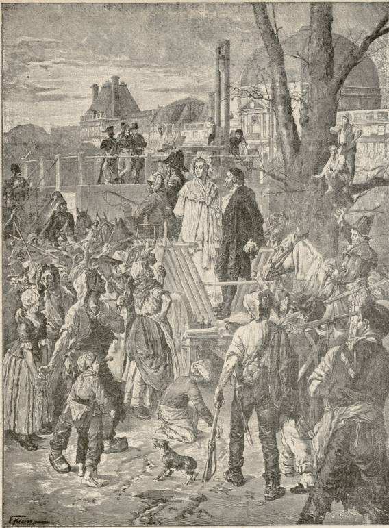
საურავნეთის დედოფალი მარია-ანტონეტა უფოტზე მიყვავი.

ისე გნელოდა. დილის სუსხი ჭეველსა და რბილში გადიოდა. დედა სიცივით კანკალებდა. მან გასწია მარჯვნივ, დაახლოვებით იცოდა, სადღე უნდა ყოფილიყო იმისი შვილი. საჩ აროდ გაიხარა ერთა ქება და მარცხნივ შეუხვია. მის წინ, მალაობლად, ნახვრად ზნელაში ამართალიყო ბარიაკადა. ხალხი არსადა სჩანდა. ორის-სამი საყენის მანძილზე დედა უეცრად შეაჩერა ვიღაცის ხმამ: „ეინ არისო“. მის წინ გაჩნდა უცნობი რევოლუციონერი ხელში. დედამ უთხრა პაროლი, რომელიც შვილისაგან ჰქონდა ჩასწაველი და გასცოლდა ბარიაკადას. მეორე ადგილას აქა-იქ კაცები ჩასაფრებულოყენენ. ზოგი ეტლის ბორბლების შუა ამოფარებულყო, ზოგი ფიტარებზე იჯდა, ზოგი-ლჯრებზე და ზოგი თავის ტრამებზე. ზოგს არ ეძინა და წუნარად მუსაიყოზდენენ.