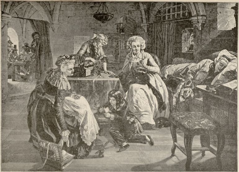
ლუი XVI და მისი ოჯახი საპატიმროში.—სურათი ვარდისა.

შპებდა ფულის დამდებს. ქნი ვირმონი მიხედა, რასაც ნიშნავდა ეს უსიტყვოდ გამოთქმული ზილი და მრისხანება.