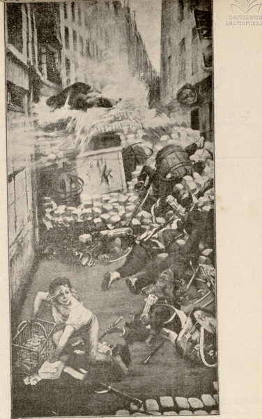
საფარნაკეთის რუგოაფიქიდან. — არაგაგებზე.

გასტანი სანამ ევაკრი ქალი მანქანას დაატრიალებდა, დიდის გაფაციცებით აღფრებდა თვალს იმის მოძრაობას. ამ დროს ქანმა ვერმონი უცებ შეხდა ევაკრი ქალს და დაინახა მოგვრძო სახის, ძლიერ გემზარია, მოუვლილი, მწვენი ფერის, ნაოკებით დასერილ-დაკუმუნული, პერგამენტის მსგავსი სახე, აბურბეღულ წარბებით და ღრმა, ჩალურჯებულ ფოსტებით, რომლებიდანაც ძლივს გამოიხუტებოდა ნაღვლი-