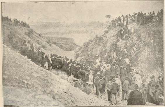
ხალხი უუერებს გეზუფიან მონივლ კახურებულ დაგის.

— ავსხავეთ? ახსავე მხოლოდ ჩიტებისა შეიძლება და არა ჩვენი, და შა! ვის შეუძლია ახსაბოს, ბორკილი შეებას ში არ დაუბრუნდება არა და არა! რაც დღე ვაღის, მით უფრო ახალ-ახალი