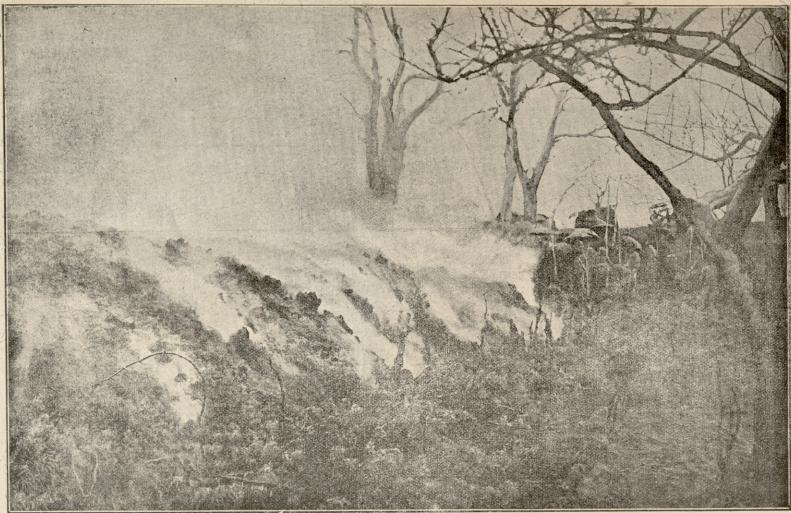
ვეზუვის მთიდან ამხეობილი ღაფა დაქუა მთის კალთბქუდა წაღვეს კენახეზი, ბაღეზი.