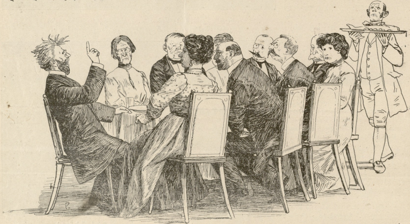
— მე ვთხოვთ პარტებზე არ ანადარკოთ, რადგან სავანი, რომელიც ჩვენ უნდა განვიხილოთ, ბერს დროს თხოვლობს.

— რას ათვლიერებ? — კარგი გორაკია... მოხერხებულ... — ჩუმად ჩაიციან ფედორმა. გორაკის დანახვაზე რაღაც მოაგონდა და დაე- ჭქარა. — იცი რა, დაშა! შენ დღეს ნუ გამიჯვარდები... ძლიერ საქიროვ ამხანაგებს მოველაპარაკო... დიდებრთა სახლისაკენ. დაშა უხალისოდ გააკეცა უკან, მისს ფიქრს და აზრს უზვეულს ტენის ვერ მოგენდებინა ქმრის სიტყვები, მაგრამ ეს სიტყვები მოსვენებას მინც არ აძლევდნენ: ისეთი ახალი, ჯერ გაუგონარი იყო იმისთვის ეს სიტყვები, ისეთი სიცხა- რითა და დაბეჯითებით იყო წარმოთქმული ფედორისაგან, რომ დაშა იმულებული იყო ანგარიში გაეწია მათთვის და არა ერთხელ და ორჯელ ვადაგებრუნებინა თავში. მოსმა ხმები მუშებისა. ფედორი გაფართოა ერთის ჯგუ- ფისაკენ, რომელსაც თავი მოეცა ერთს ადგილას და ცხა- რე ბაასი გაფართოთა რაღაცაზე. ა. ლომთაბაძე. (შემდეგი იქნება.)