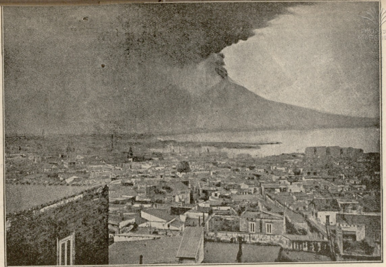
ფედორის წვიცა ქალაქ ნუხალში. ნუხალ მფრქვევი შთა გეხუბა ქალაქ ამოდრად და სმინელა უბედურებას მიყენე. შადათქოს.

— ცუდსა ავსხავეთ ეანდარმები, აი შენი ბედნიერება... ჩაილაპარაკა ბოლოს და შამ.