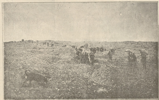
შესანუბელი ხალხი სტეპით დადის უბედურების შესწერებლად.