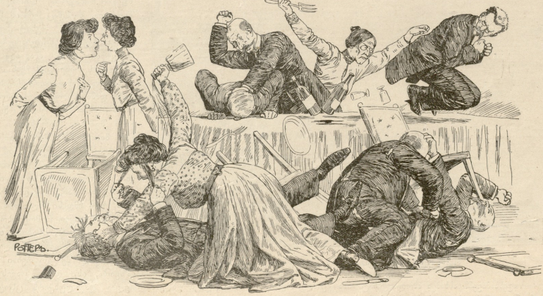
ვერ შთამინეს, დაიწვეს დაპარკი.