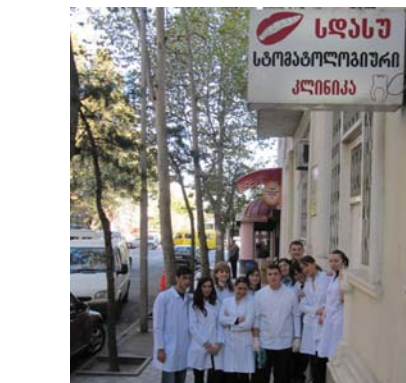
სდასუ-ს ქართულ-ინგლისურ სტომატოლოგიურ კლინიკას საქართველოში ანალოგი არ გააჩნია.