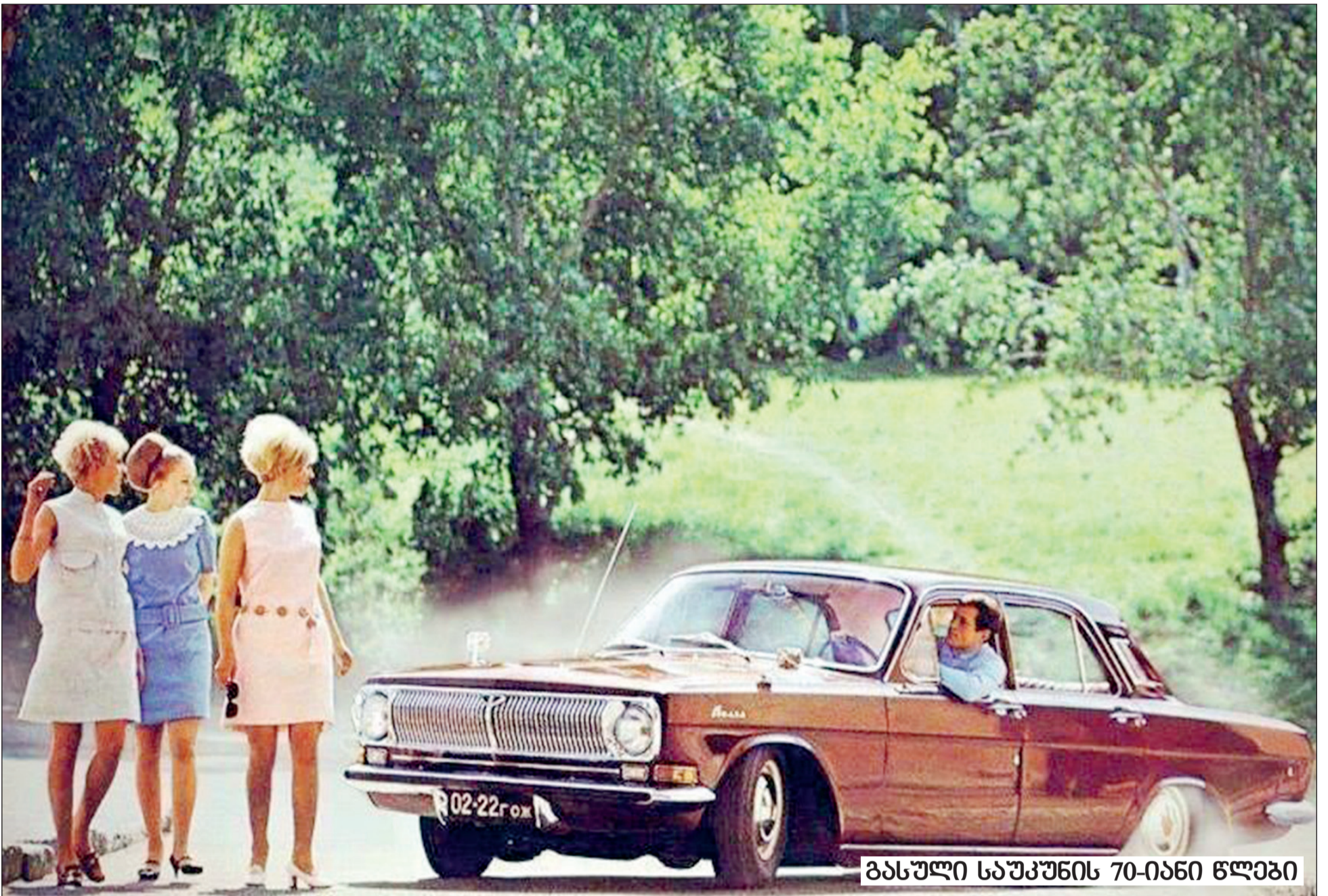
გასული საუკუნის 70-იანი წლები