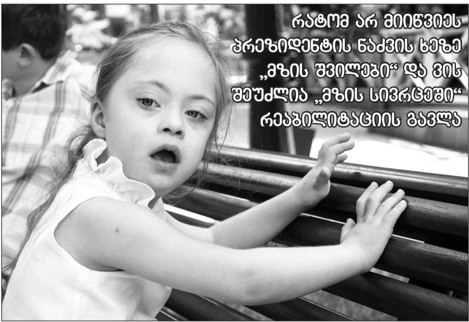
რატომ არ მიიწვიეს პრეზიდენტის ნაძვის ხეზე „მზის შვილები“ და ვის შეუძლია „მზის სივრცეში“ რეაბილიტაციის გავლა

– თავდაპირველად, ფართს მიცკევიჩის ქუჩაზე ვქირაობდით, მაგრამ უსიამოვნების გამო, იქიდან წამოსვლა მოგვიხდა, ანუ