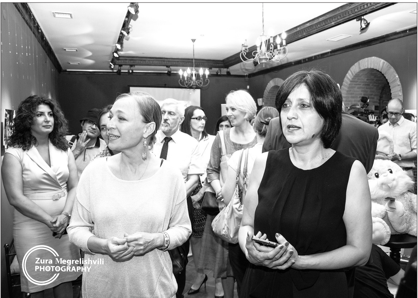
Zura Megrelishvili PHOTOGRAPHY