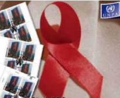
Block-FDC... (Caption text partially obscured)

проблемы декриминализации потребителей инъекционных наркотиков, реформы тюремной системы, а также другие меры, включая маргинализацию группы в целях снижения риска принятия решений в контексте возможных путей ответа на эпидемию в регионе. Несмотря на сравнительно низкий уровень распространения инфекции по региону в целом, темпы роста инфицирования, зафиксированные за последние несколько лет в Эстонии, России и Украине - среди наиболее высоких в мире. Каждый сотый взрослый, живущий в этих трех странах, ВИЧ-инфицирован. 1% инфицированного взрослого населения - это рубль, после которого усилия поведенческого вмешательства по многим странам оказались безуспешными. Если вовремя не остановить распространение инфекции, это успехи человечес-