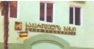
Обновленный Зугдидский филиал

Как идет процесс расширения банковских продуктов? В результате энергичной кредитной политики «Сакартвелос банки» в прошлом году в Тбилиси, регионах страны было осуществлено немало значительных проектов. В этом плане следует отметить Центр утилизации графита профессора Давида Татшвирали, который был построен и оснащен современной аппаратурой благодаря средствам, выделенным «Сакартвелос банки».