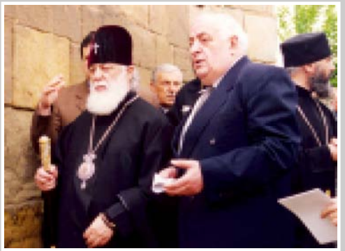
Каталикос-Патриарх Всея Грузии, Святейший и Блаженнейший Патриарх Илия II и президент «Сакартвело банки» Владимир Патенишвили.