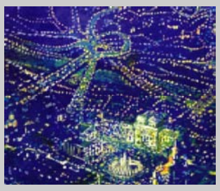
Красочная диорама «Сакартвело» (художник - Гия Бугадзе) украсила операционный зал на первом этаже «Сакартвелос банки».