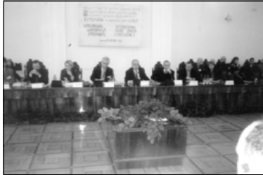
Профсоюзные лидеры участвуют в конференции в Тбилиси.

28 февраля в Крцанской резиденции в Тбилиси состоялась правительственная конференция на тему "Социально-экономические реформы в Грузии и роль профсоюзов в развитии социального диалога". Организаторами конференции являются Международная организация труда (ЛО), Международная ассоциация свободных профсоюзов (ICFTU) и Объединение профсоюзов Грузии (GTUA).