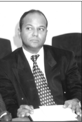
Интеллигентного, немногоговорящего Джозефа Оузна смело можно назвать человеком, который распоряжается 510 миллионами долларов. Он возглавляет Миссию Всемирного банка в Грузии, общий объем кредитов которого за шесть последних лет в нашей стране составил именно эту сумму.

Джозеф Оузн уже завоевал репутацию менеджера, который хорошо знает, как максимально эффективно использовать эти огромные средства - 510 миллионов долларов.