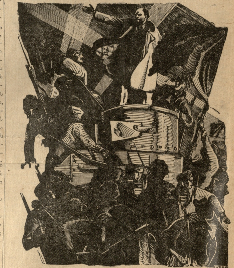
ლენინი სიტყვას ამბობს ჯავშანთან. გრავიურა ხეზე პ. ნ. სტარინისთვის.