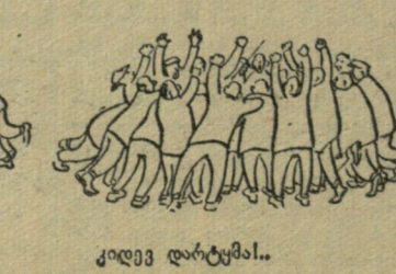
დარტყმა... კიდევ დარტყმა... გოლი...