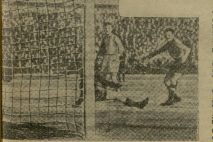
სურათზე: თბილისელ მენაბლეს ვაჟქვს მეორე ბურთი.

თბილისის არბიელებმა მატჩი ჩე- ლიაბნსკის „აენგარის“ წინააღმ- დეგ დაიწყეს ტრადიციული შეტევე- ბით მარჯვენა ფრთიდან. შეტევებს მაღე მოჰყვა სახიფათო მომენტებიც: უშედეგოდ დაიკარგა ნორაკის კარ- გი გადაცემა ცენტრში, რამდენიმე კუთხური საჯარიმო გამოუყენებელი იქნა თავდასხმელთა დავიანების გამო, მელაშვილის ძლიერი დარტყმა შორიდან აიღო მეკარე სილორგია.