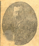
მ. კ. უდიანი (იხ. ამავე ნომერში)