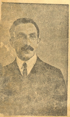
ონსტანტინეს-ძე ხირსელი 17 (წ. იხ. 1916 და 1917 წ. № 48)

მიიღება სკლის მოწერა დაწვრილებით იხ. მე-16-ე გვ.