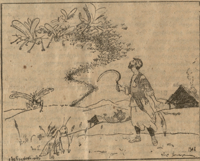
ქართველი გლეხის ჩივილი: ... ჩემი ცოლი ბრაღია, თუ მემრისაც ასე რიგად დამეხვია კალია!

და თავჩალუნული დაეშვა ცხოვრების დაღმართზე.