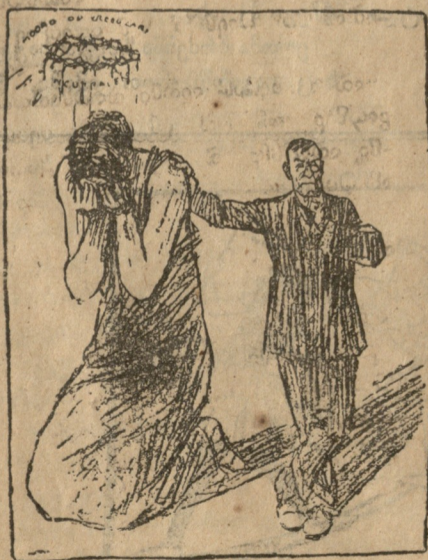
ვიღსონი. გულს ნუ გაიტებს, ნოტას დავერ და გაფუჭავანი!