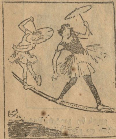
ნეტრალ სახელმწიფოთა მდგომარეობა.