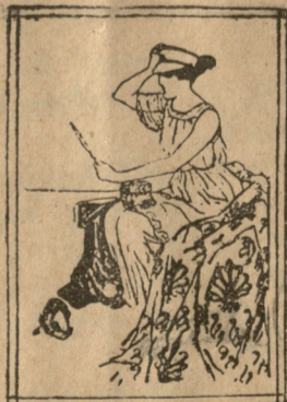
საბერძნეთი. რომელი ქული უფრო მომიხდება? გერმანელების თუ მოკავშირეებისა?