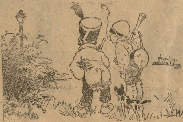
ორი სტრატეგი: ვგონებ დროა ჩავფიროთ მსოფლიო ომში, თორემ უჩვენოთ ბრძოლის ბედი არ გადასწყდება.

ერთმა ბრძენმა სთქვა: საქაროა ხალხიც დავარწმუნოთ იმაში, რომ ომი