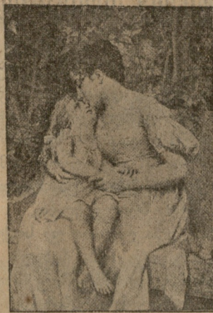
ღედის ალერსი, ნახატი პეროლტისა.