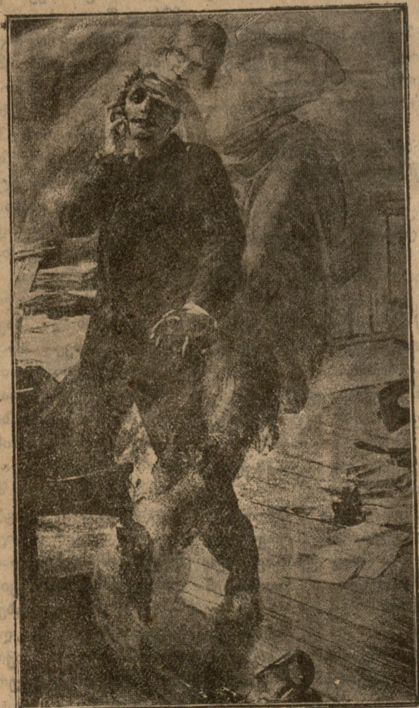
მეტნის ოცნება. ნახატი მენანისა.