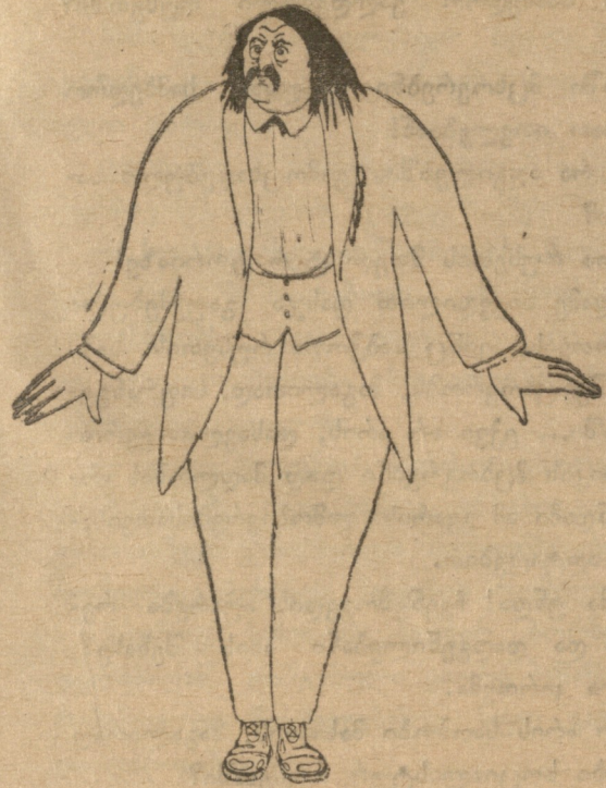
ფრიდრიხსენი — მასალიტინოვი (ცხოვრების ბრწყინებში).