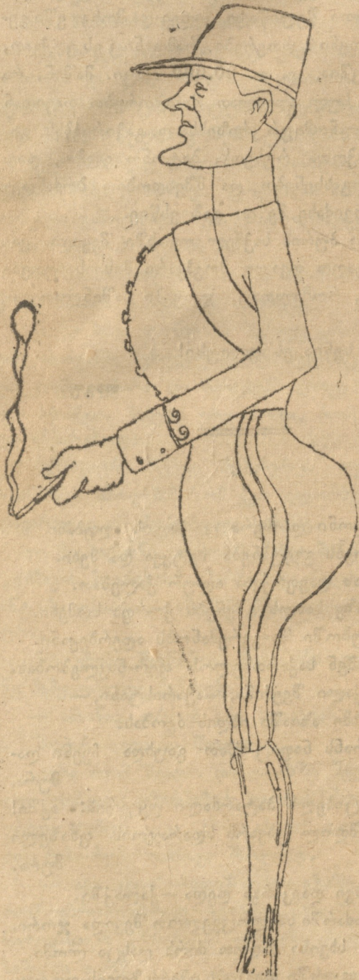
ლენინი — ლენინი — ბაკშევი (ცხოვრების ბრწყინებში).