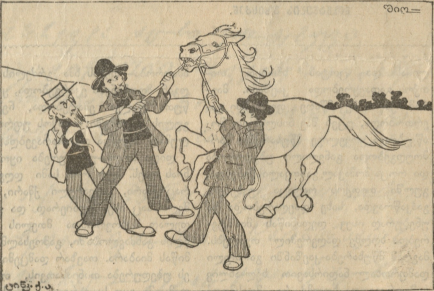
სოციალიზმი 1905 წელს.