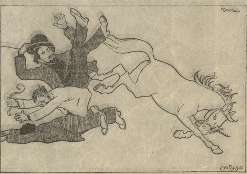
სოციალიზმი 1915 წელს.