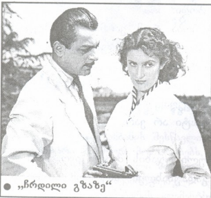
● „ჩრდილი გზაზე“

და იყო დიდი მხი- არულება. ვის ადარ ნახავდით მათ წრეში – მსა- ხიობებს, მსატე- რებს, მწერლებს. ჩემთვის ბენდი- ერება იყო ამ არა- ჩვეულებრივ, ნი- ჭიერ ადამიანებთან ყოფნა. ბევრი რამ შემმატა მათთან ურთიერთობამ. ცე- დილობდი, გვერდი- დან არ მოვშორე- ბოდი, თითოეული სიტყვა მომესმინა და დამემახსოვრე- ბინა. დედამ გარ- დაცეკლების შემ-