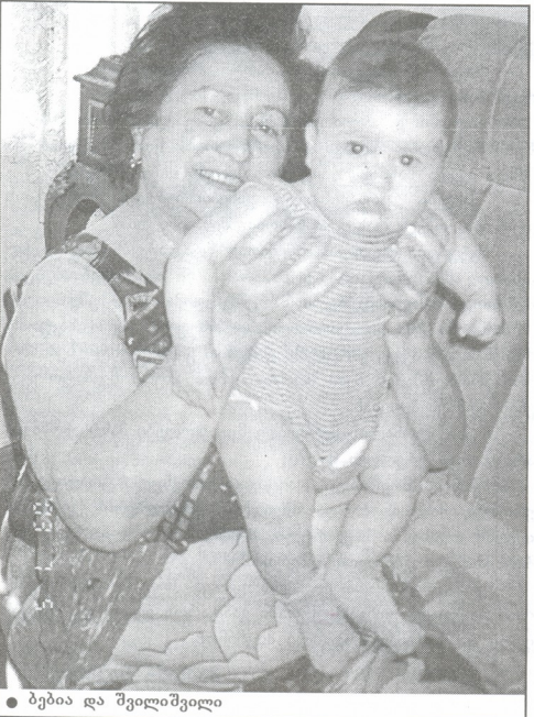
● ბებია და შეილიშეილი

განათლებაში ჰედაგოგიური მიდგომის შეცვლა დროის მო-