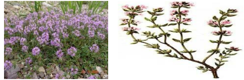
ნახ.1. ბეგქონდარას ბუჩქ-ბალახი

რად მდგომი საყვავილე ყლორტები (ნახ.1), სასიამოვნო, სპეციფიკური არომატის მქონე ვარდისფერი და მოიისფერო ყვავილებით.