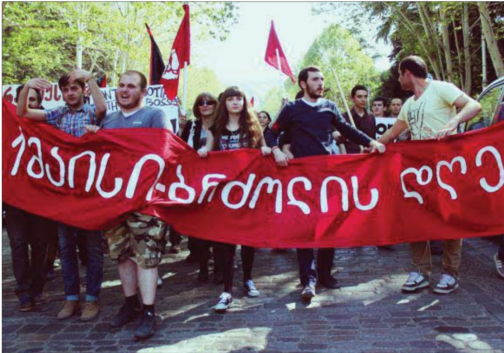
იხილეთ მე-3 გვერდზე

„ქართული ოცნების“ მხარდამჭერმა „ოცნების“ მაისური ღანვა