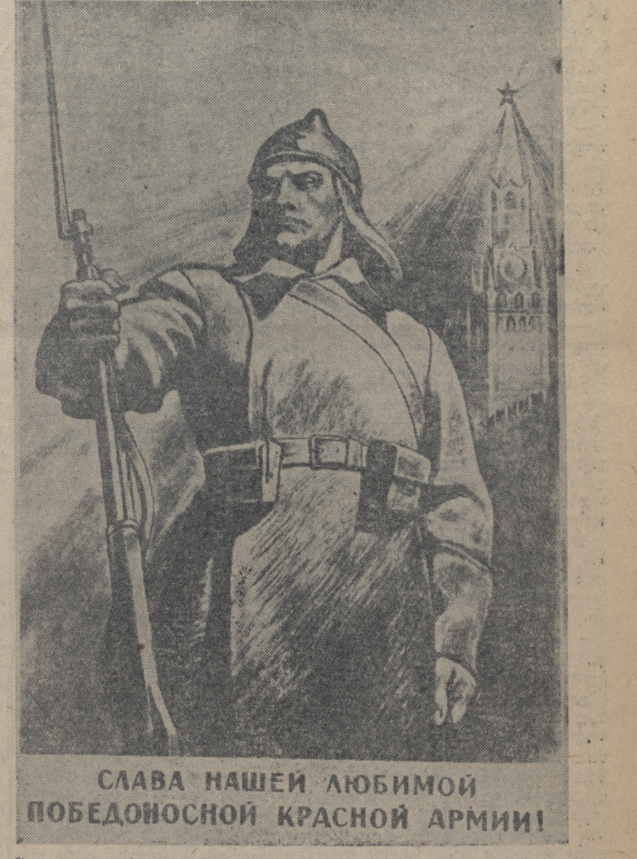
სლავი ჩაქვანის გმირი მებრძოლი პლატონის კომანდირი, კავშირის წევრი...