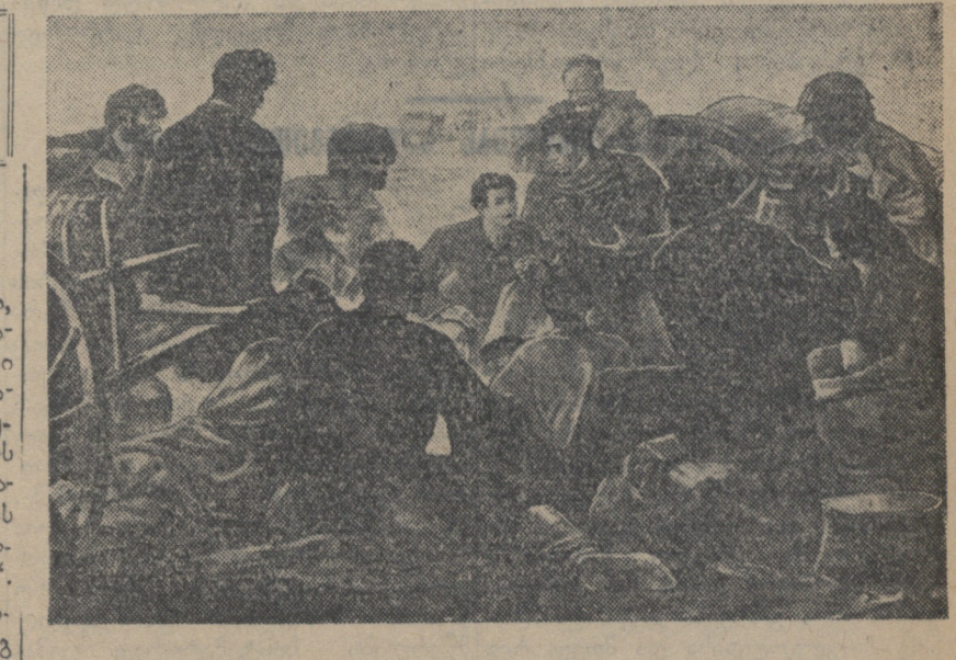
ამიერკავკასიის კავრულიანი ნარსულიანი (1905 წ.) მხატვ. კ. ჯუღაშვილის ნახატი.