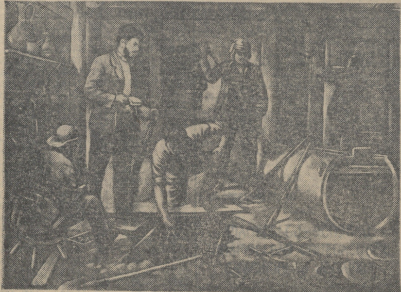
აიარის არალტერნატიული საწარმო კოათურის რაიონში (1905 წ.) მხატვ. გ. ნიკოლაძის ნახატი.