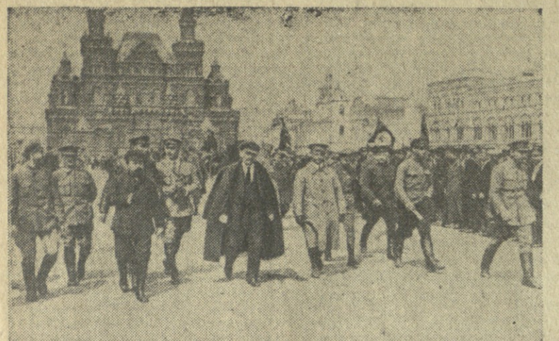
სწრაფი: მარცხენა, ზემოთ — ვ. ა. ლენინი წითელ მიწებზე 1919 წლის 25 მაისს, მარჯვნივ — მუხა კ. პ. ივანოვის სახელზე შედგენილი მემორიალური წერილი, რომელიც ვ. ა. ლენინის ემბლემა კერძო მფლობელობაში და რბილითავე 1917 წლის აგვისტოში გადავიდა ფრენის სახელზე.