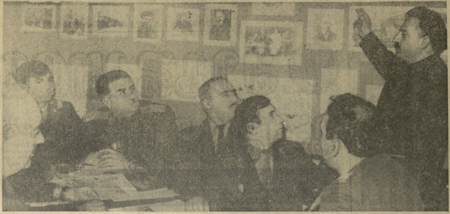
კარგადა დაყვანილი პირად შემადგენლობას შორის პოლიტდამსახურებით მდივანს მარკოზის შინაგან საქმეთა რაიგანყოფილებაში. აქ ხშირად ტარდება ლექციები და საუბრები თემაზე: „საბჭოთაო იდეოლოგიის კრიზისი“ (ლექტორი ი. ა. სტეპანოვი). ...