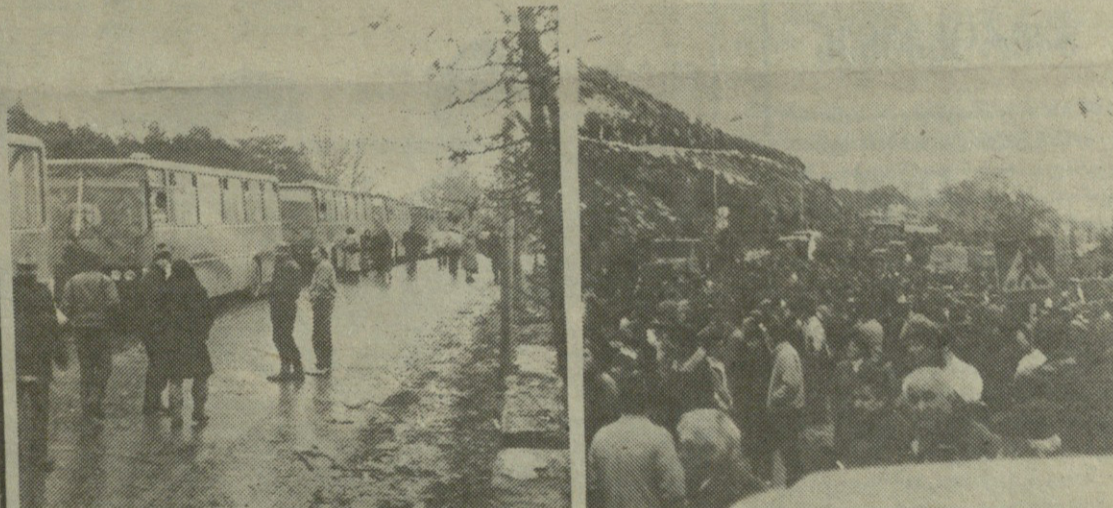
სურათში: ცხინვალის შეხახველ თან.