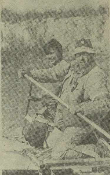
НА СНИМКАХ: участни- ки туристического похода по реке Алазани; на привале.