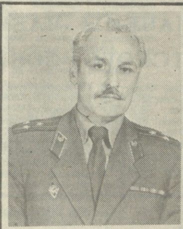
სამინისტროს კულტურის სახლის დარბაზში გამართულ კულტურის გაფართოებულ სხდომაზე...