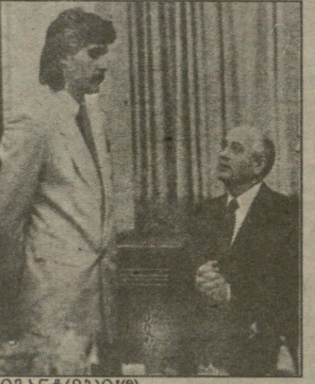
ბიგანტ(მბი)!(?) ფოტო ფურნალიდან „KREP-SINIO PASAULTS“ („კრეპსინიო პასალტს“ - კრეპსინიო პასალტსის სამყარო, ლიტვა).