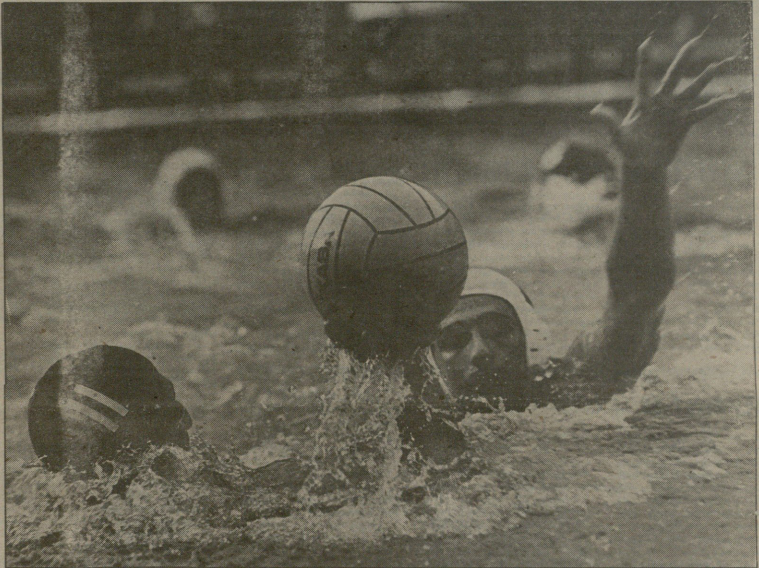
...თავის დროზე საერთაშორისო კლასის წყალბურთელებიც გვეყავდა და ძლიერი გუნდებიც. ტრადიციების დაბრუნებას, ალბათ, საკმაოდ დისკორდებმა. თუმცა, როგორც სპეციალისტები ამბობენ, უკვე გამოჩნდნენ ახალგაზრდა, იმედის მომცემი სპორტსმენები...“ წყალბურთელთა ეროვნული ჩემპიონატის 1 ტურის შესახებ იხილეთ მე-2 გვერდზე.