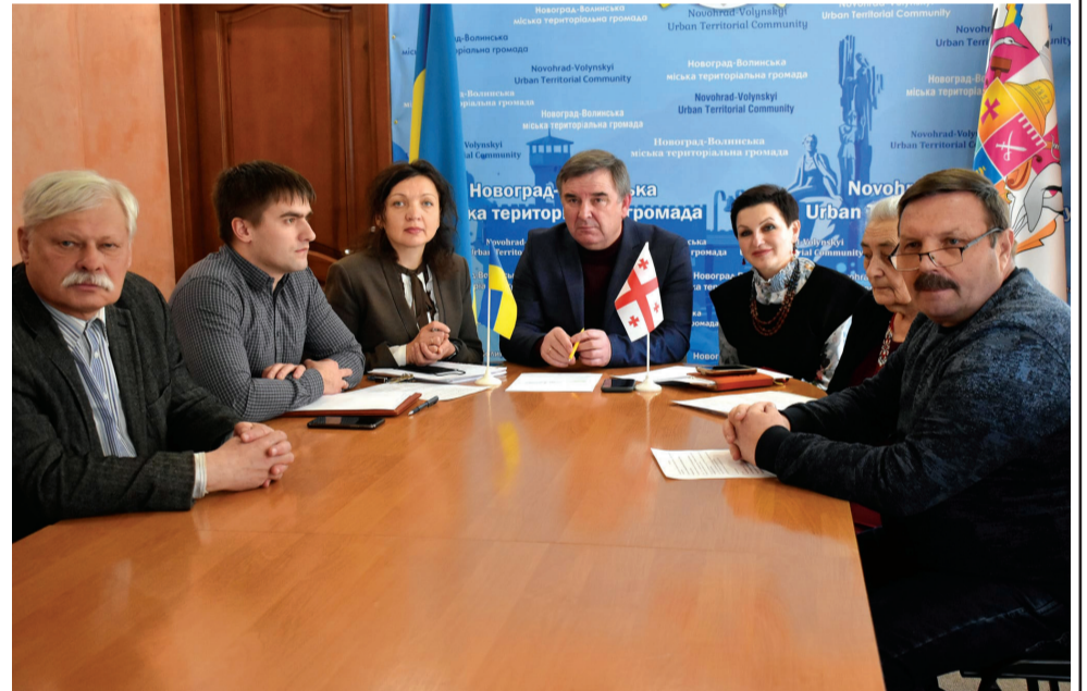
რედაქციისგან: აღნიშნული შეხვედრა რუსეთის მიერ უკრაინაში შეჭრამდე ორი დღით ადრე შედგა.

შეხვედრა გამოჩენილი უკრაინელი პოეტის - ლესია უკრაინკას დაბადებიდან 151-ე წლითავისადმი მიძღვნილი საიუბილეო ღონისძიებების ფარგლებში ჩატარდა.