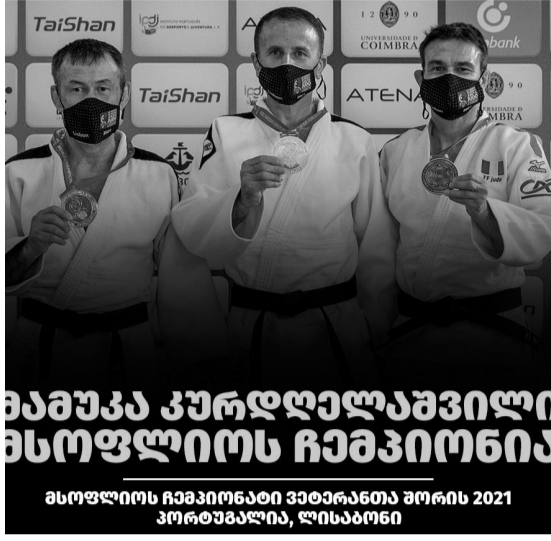
მამუკა კურდღელაშვილი მსოფლიოს ჩემპიონია მსოფლიოს ჩემპიონატი ვატიარათა შორის 2021 კორთაგალია, ლისაბონი