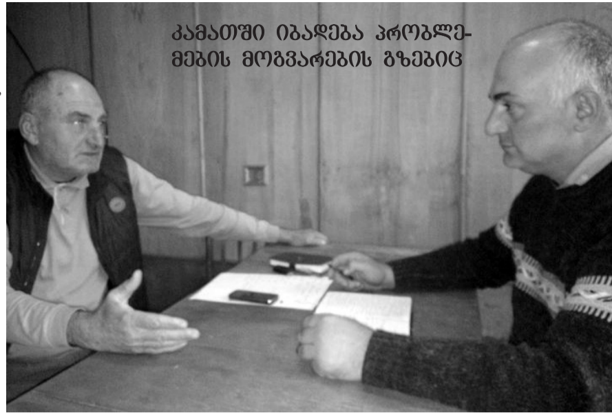
კამათში იბაღება პრობლემების მოგვარების გზების

აბილიტაცია ჩაუტარდა, დაიბურდა და მოეწყო წყლის ოთხი ჭაბურღილი თავისი რეზერვუარებით.