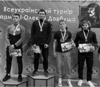
Всеукраїнський турнір пам'і Олександра Довбуша

15 ოქტომბერს უკრაინის ქალაქ კოლონიამ თავისუფალ ჭილაობაში დიდ საერთაშორისო ტურნირის უმასპინძლა, რომელიც ახალგაზრდებს 2001-2003 წლებში დაბადებულ სპორტსმენთა შორის გაიმართა. ტურნირში საქართველოს ნაკრების შემადგენლობაში მონაწილეობდნენ ა(ა)იპ „საგარეჯოს სპორტგაერთიანების“ თავისუფალი სტილის მოტივაციითა და მწვრთნელების დახმარებით.