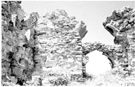
„არს მთის კალთას, სკანდას, სასახლე მეცხეთა და ციხე დიდი, დიდშენი“ ვახუშტი ბაბრატიონი