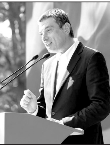
ადამიანებზე და შეუქმნას თანაბარი პირობები ყველას.

გიორგი გახარია თქმით, სახელმწიფოს ძირითადი ფუნქცია არის სისტემურად იზრუნოს