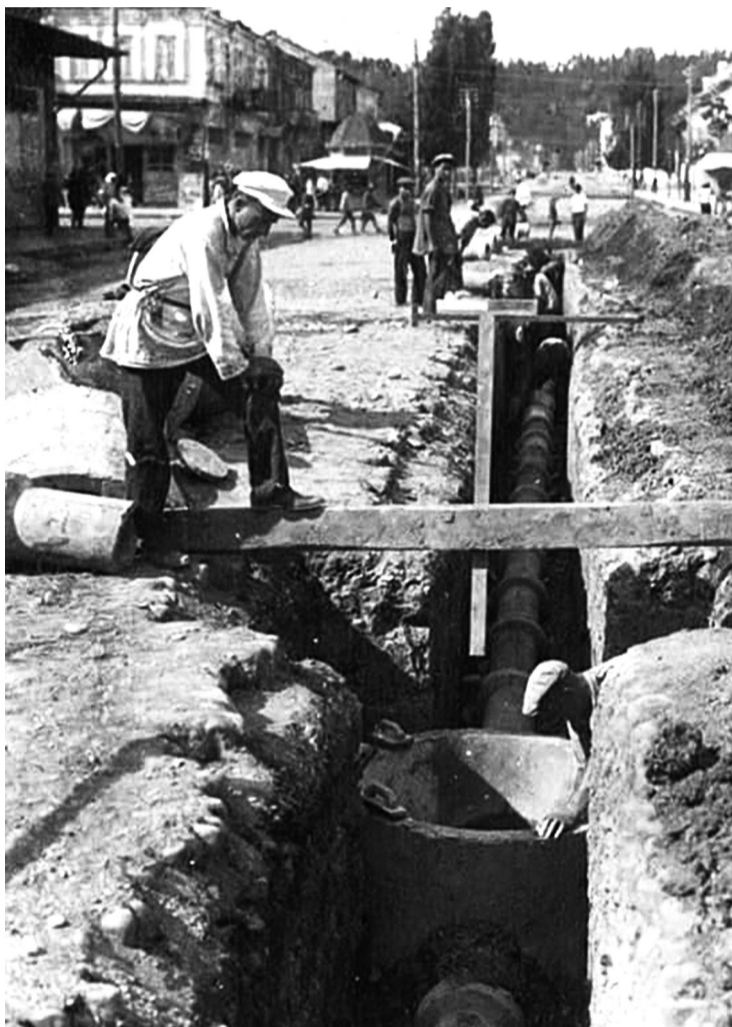
Сухум, 1932 г.