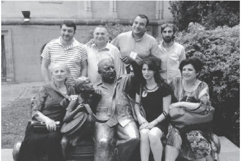
ად უნდა გაგრძელდეს. წლებგანდელ ფესტივალზე წარმოდგენილ 14 სპექტაკლს 10 თეატრალური კრიტიკოსი ავირდებოდა, რომლებმაც პროფესიული თვალსაზრისით მართებული, რაციონალურად გადაწყვიტეს სხვადასხვა ნომინაციაში გამარჯვებულთა ვინაობა.

ლა კი ალფონსო კასონას პიესებია. "ველური" იშვიათად იდგმება ქართულ